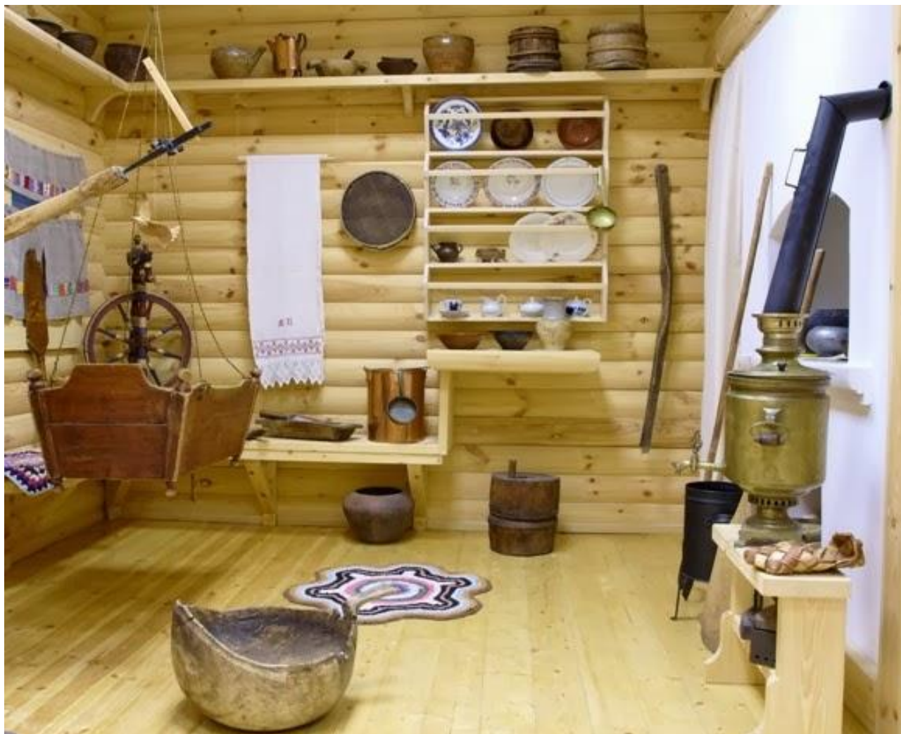
Печной угол (экспозиция выставки "Русский северный дом", г. Северодвинск, Архангельская обл. )

Часть избы от устья до противоположной стены, пространство, в котором выполнялась вся женская работа, связанная с приготовлением пищи, называлась печным углом . Здесь, около окна, против устья печи, в каждом доме стояли ручные жернова, поэтому угол называют еще жерновым . В печном углу находилась судная лавка или прилавок с полками внутри, использовавшаяся в качестве кухонного стола. На стенах располагались наблюдники - полки для столовой посуды, шкафчики. Выше, на уровне полавочников, размещался печной брус, на который ставилась кухонная посуда и укладывались разнообразные хозяйственные принадлежности.