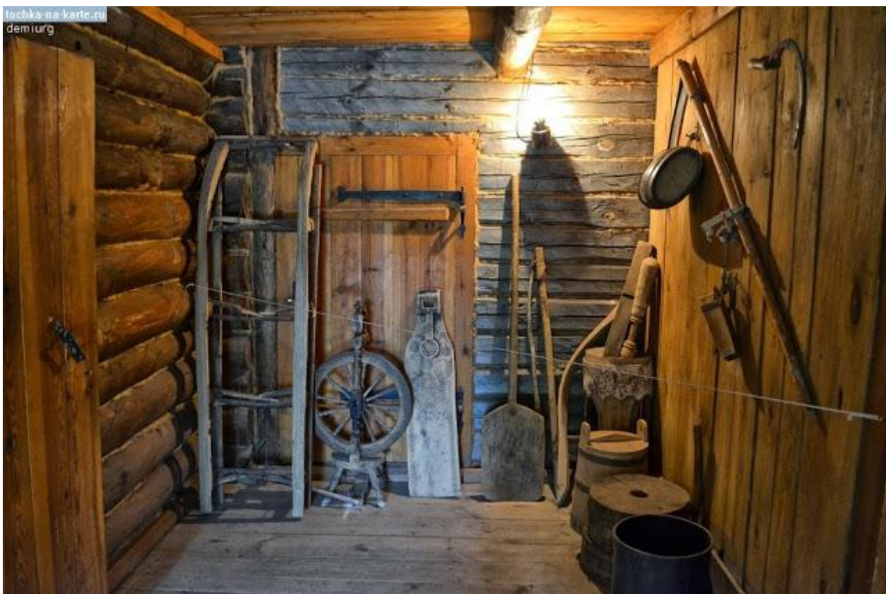
Сени в доме Есениных в с. Константиново Рязанской губернии ( дом-музей Сергея Есенина )

В саму избу вела низкая одностворчатая дверь , вытесанная из двух-трех широких пластин твердого