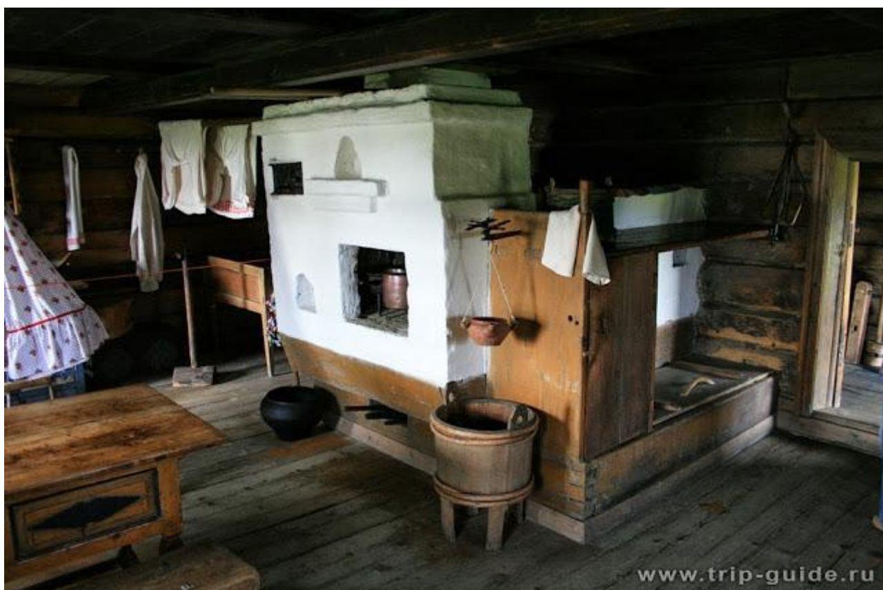
Печь в доме крестьянина Щепина ( музей-заповедник Кижы )

Русская духовая печь постепенно сформировалась из открытого очага, известного у древних славян и угро-финнов. Появившись очень рано (уже в IX веке повсюду распространены и глинобитные печи и печи каменные), русская печь сохраняла свою неизменную форму более тысячелетия. Её использовали для отопления, приготовления пищи людям и животным, для вентиляции помещения. На печи спали, хранили вещи, сушили зерно, лук, чеснок. Зимой под опечком держали птицу и молодых животных. В печах парились. Причем считалось, что пар и воздух печи более здоров и целебен, чем воздух бани.