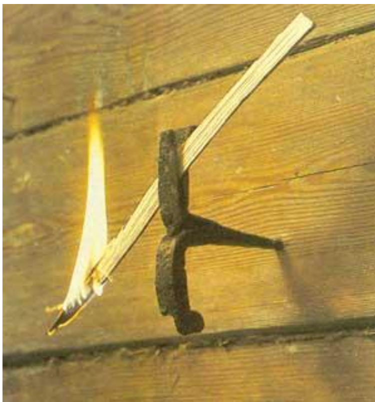
Лучина, закреплённая в светцах

Однако окна, при их “слепоте”, давали мало света. И потому даже в самый солнечный день приходилось освещать избу искусственно. Самым древним устройством для освещения считается камелек — небольшое углубление, ниша в самом углу печи (10 X 10 X 15 см). В верхней части ниши делали отверстие, соединенное с печным дымоходом. В камелек клали горящую лучину или смолье (мелкие смолистые щепки, поленца). Хорошо просушенные лучина и смолье давали яркий и ровный свет. При свете камелька можно было вышивать, вязать и даже читать, сидя за столом в красном углу. Присматривать за камельком ставили малыша, который менял лучину и добавлял смолье. И лишь значительно позже, на рубеже XIX-XX веков, камельком стали называть маленькую кирпичную печку, пристроенную к основной и соединенную с ее дымоходом. На такой печурке (камельке) готовили пищу в жаркое время года или ее дополнительно топили в холода.