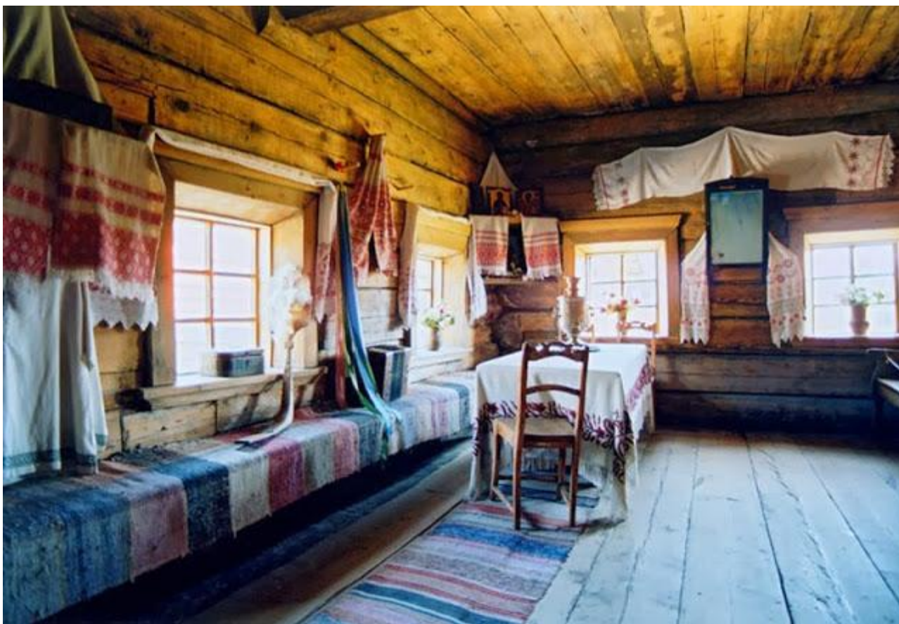
Красный угол ( архитектурно-этнографический музей Тальцы, Иркутская область )

между боковой и фасадной стеной в глубине избы, ограниченное углом, что расположен по диагонали от печи.