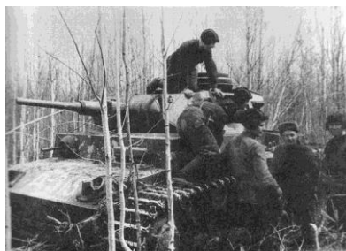
Трофейный танк из состава 107-го ОТБ, Волховский фронт, апрель 1942 года.